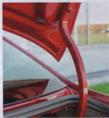
▲ Петли багажника выступают, но не так сильно, как, например, у Logan

тембр при этом не переходит на визгливые тона. А на низких и средних оборотах он «поет» вполне приемлемо. Поэтому записывать не слишком хорошую шумоизоляцию в разряд недостатков не будем.