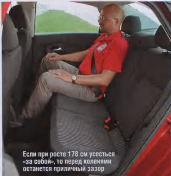
Если при росте 178 см усесться «за собой», то перед коленями останется приличный зазор