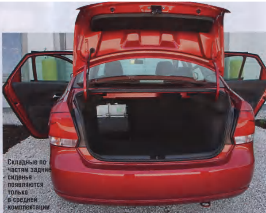
Складные по- частям задние сиденья появляются только в средней комплектации