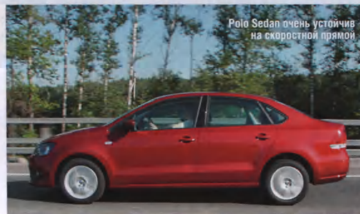
Polo Sedan очень устойчив на скоростной прямой

Не пасует Polo Sedan и перед кровенно ухабистыми грунтовыми дорожками, на которых «порезвил» грузовик: довести подвеску до пробоя очень трудно, а приличный клиренс позволяет пропустить многие неровности между колесами.