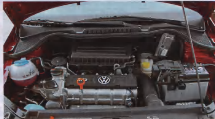
▲ 1,6-литровый 16-клапанный мотор с распределенным впрыском топлива тяговит и динамичен, правда, шумноват на «верхах»