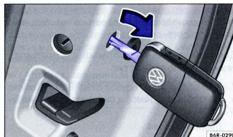
Илл. 126 Аварийное запирание автомобиля ключом (а/м с левым рулём). В автомобиле с правым рулём расположение зеркальное.